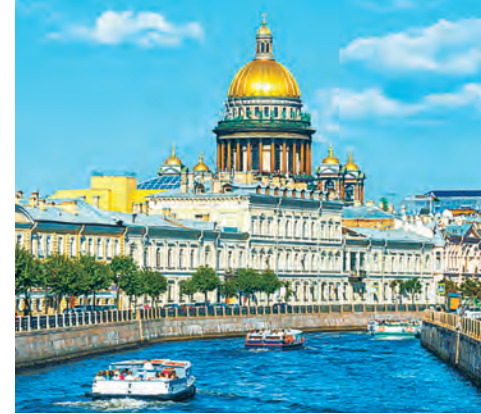
Исаакиевский собор – символ Петербурга, без которого невозможно представить этот город

Куда в первую очередь спешат туристы в столице России? Да, на Красную площадь, к собору Василия Блаженного и ГУМУ. Традиционный маршрут: Александровский сад – исторический Арбат – набережная Москвы-реки – ВДНХ – «Москва-Сити».