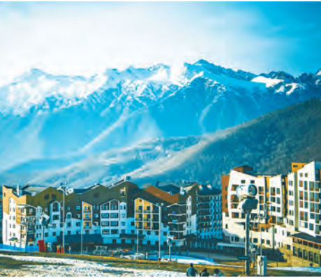
В Сочи вы можете попробовать себя в зимних видах спорта, прокатиться на горных лыжах или санках, насладиться катанием на коньках

СОЧИ. Еще один интересный маршрут для перелета из Минска – Сочи. Билеты на прямой рейс туда и обратно стоят от 142 евро (492 бел. руб.). Время полета