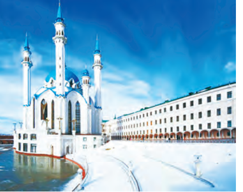
Казань славится множеством старинных достопримечательностей. Здесь красивые мечети, православные храмы, футуристические небоскребы, музеи, набережные и парки

графию на фоне музея «Эрарта» и прогуляться по Невскому проспекту. А еще есть Исаакиевский собор, Петропавловская крепость, Казанский собор... В Питере стоит побывать хотя бы раз в жизни!