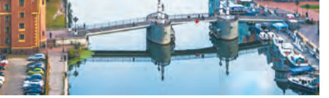
Калининград называют «русской Европой» не просто так. Город поражает своей архитектурой

В Казани вы можете узнать больше о татарской культуре, исламской религии и отведать национальные татарские блюда, такие как чак-чак, кыстыбый, попробовать айран и многое другое.